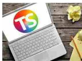
La scuola a prova di bomba? Macché, è una mina antiuomo...