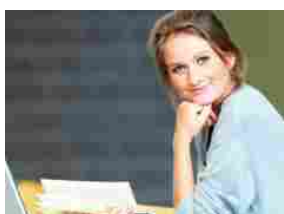
GaE, dentro un dottore di ricerca. Il Miur ci ripensa?

Articoli correlati Di più dello stesso autore