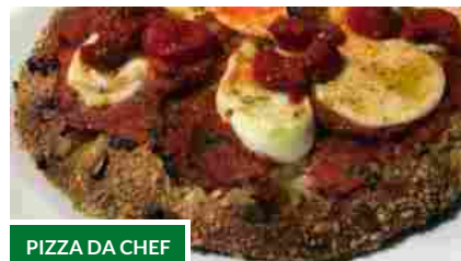
PIZZA DA CHEF

Tracce di gas nervino nel ristorante italiano