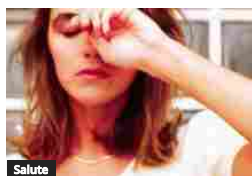
Salute 10 regole per dormire bene