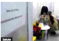
Salute 30mila bambini non in regola