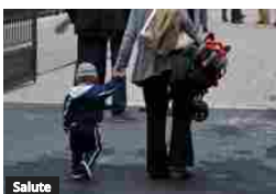
Salute Non ho vaccinato mio figlio, che succede ora?