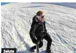
Salute Sci e snowboard, +15% lesioni