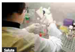
Salute Meccanismo stana Hiv latente