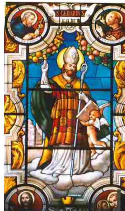
Potenza: nella Cappella dei Celestini l'inaugurazione della mostra documentaria "IX Centenario. 1119 – 2019. San Gerardo Vescovo"