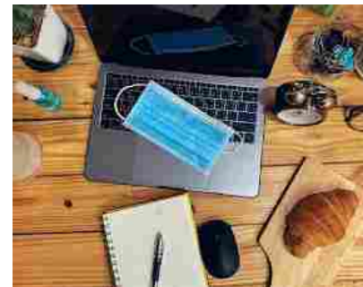
Come lo smart working ci ha fatto ripensare al lavoro