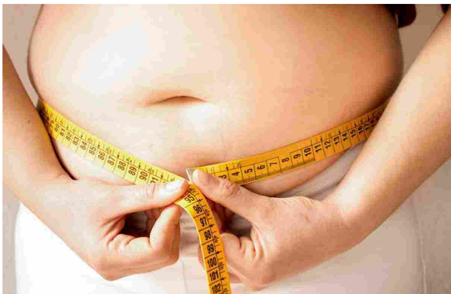
Obesità, effetto Covid: il 44% italiani in sovrappeso

Publicato il 10 Ottobre 2020 12:23 | Ultimo aggiornamento: 10 Ottobre 2020 12:23