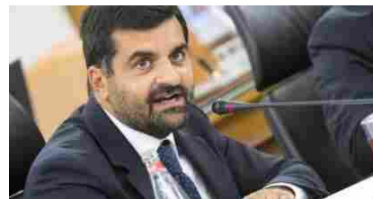
Palamara, perché i testi gli sono stati negati? Ricorso alla Corte europea?

In Italia si stimano circa 2 milioni e 130 mila bambini e adolescenti in eccesso di peso, pari al 25,2% della popolazione di 3-17 anni secondo l'Istat. (fonte AGI)