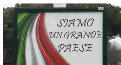
Coronavirus in Italia: morti, contagi e guariti. I numeri giorno per giorno